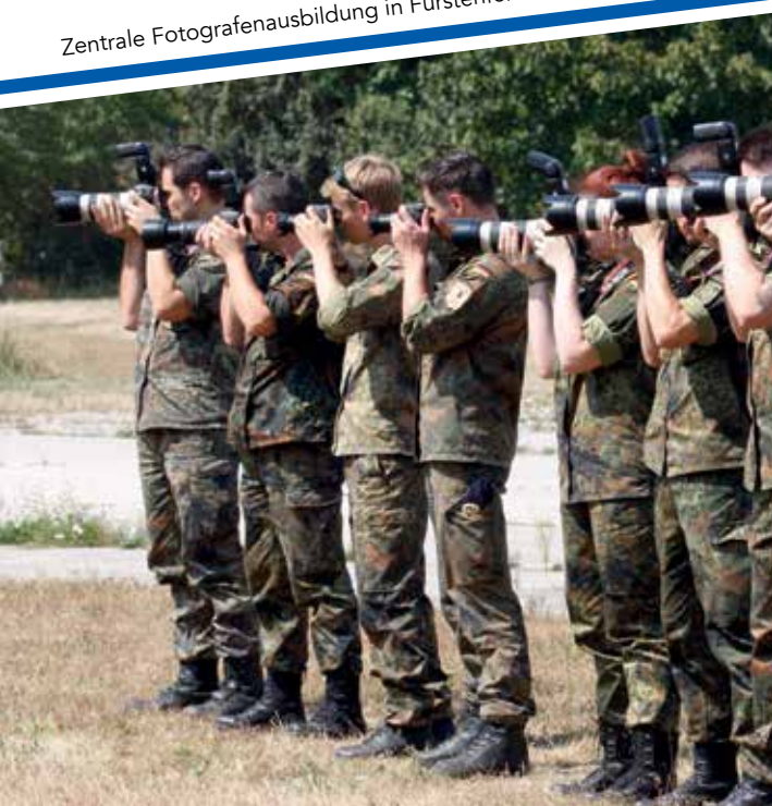
Zentrale Fotografenausbildung in Fürstenfeldbruck

Die Ausbildung ist nicht nur reine Wissensvermittlung im Unterrichtsraum oder Studio. Auch die Arbeit am bewegten Objekt wird gelehrt – sprich am Flughafen, in der Stadt oder in der Natur.