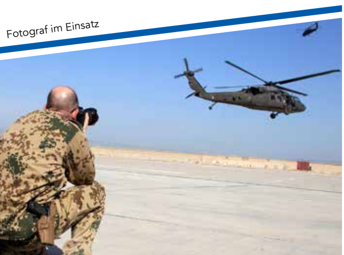
Fotograf im Einsatz

Das AZAALw ist in der Bundeswehr für seinen hohen Qualitätsstandard im Bereich Fotografie bekannt. Die Gefahr lauert überall; mit der digitalen Fotografie ist auch die Gefahr der Manipulation in den letzten Jahren immer mehr gestiegen. Auf dem Lehrgang „Elektronische Bildverarbeitung / Photoshop“ lernt man unter anderem, woran Bildmanipulationen ggf. zu erkennen sind sowie die Basics und fortgeschrittenen Techniken der Bildoptimierung/Bildbearbeitung. Damit leistet das AZAALw einen Beitrag, sich vor falschen Informationen zu schützen.