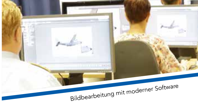
Bildbearbeitung mit moderner Software

Auf den Laufbahnlehrgängen „Fotografie Modul I & II“ werden neben den theoretischen Kenntnissen auch Bildbearbeitung, Layouttechnik und das Arbeiten im Studio ausgebildet. Die Teilnehmer lernen verschiedene Aufnahmeformate und hochwertige Kameratypen kennen und sicher zu handhaben. Aber auch die Arbeit am Motiv nimmt ihren Raum ein. Der Aufbau in einem Fotostudio, das Setzen der Lichter sowie das Einstellen von hochwertigen Blitzbelichtungsanlagen, aber auch das richtige „in Szene setzen“ des Motivs werden intensiv geübt.